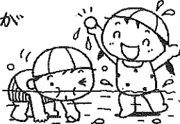
(ビニール、拾いも たのしみ!!)

6月20日プール開き、水位 25cm位の プールに初めて入った子ども達、わあひびき!! お 風呂みたい!!とお喜び。それから毎日「今日プ ール入れる?」と朝から楽しみな子ども達です。顔の水が かかるとイヤがる子もいるのですが 平気でたくましいたんぽぽ組 今年は何回入れるでしょうか その度衣服の着脱がうまく なっていくようです。